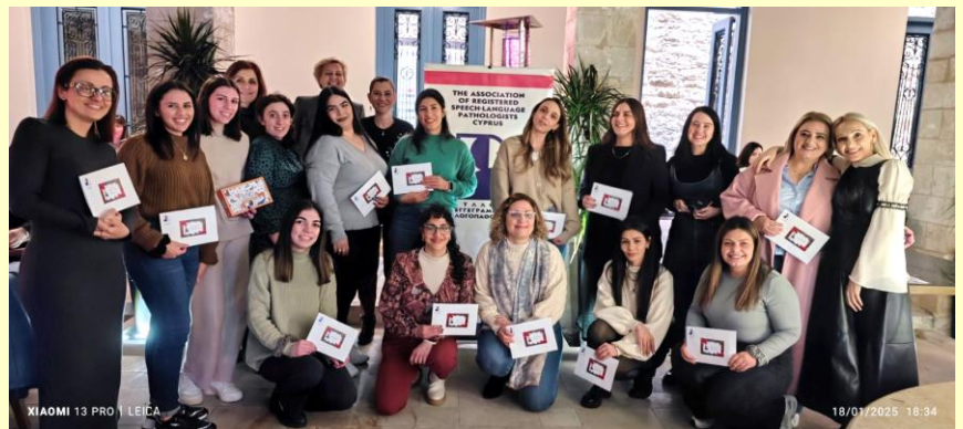
Μετά την κλήρωση των δώρων. Ευχαριστούμε όλους τους χαριηγούς μας!