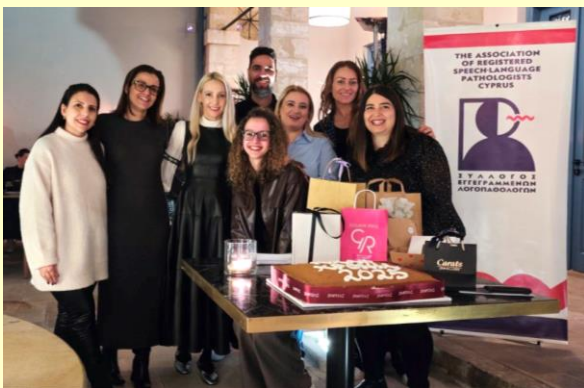
Ευχαριστούμε τα μέλη της Επιτροπής Διαφώτισης για την άψογη διοργάνωση!

Ευχαριστούμε όλα τα μέλη του ΣΥΕΛ για την παρουσία τους!