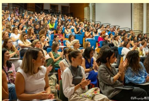
Άποψη του αμφιθέατρου